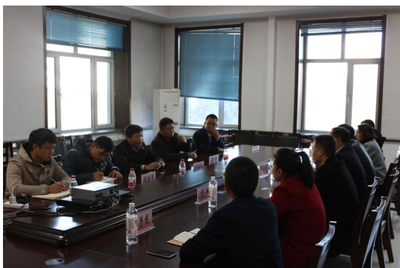
朱栋凯局长介绍宿迁市科研合作项目