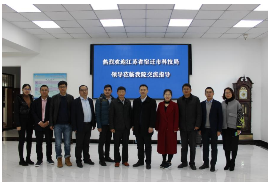
与会双方合影留念

江苏省宿迁市科技局此次到访我院，促进了我院的校地、院地合作与交流，提升了学院的知名度。