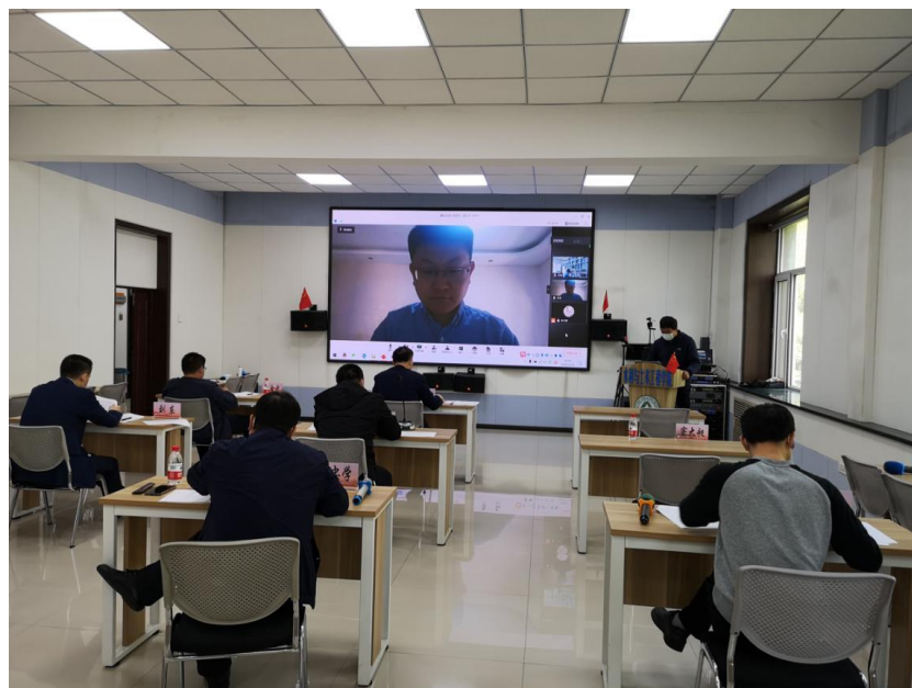
通过腾讯会议远程面试