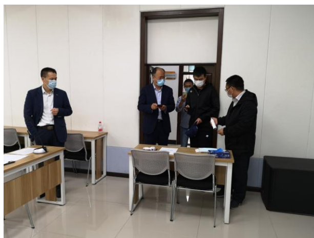
人事处相关领导和评委扫码进入会议现场

为进一步规范疫情期间面试工作的程序和流程，保证 2020 年（上）公开招聘教师面试工作的顺利进行，我院严格按照防疫相关要求，组织评委进行现场网络遴选。