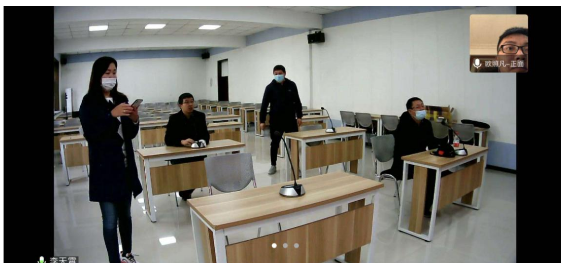
研究生复试模拟演练现场

根据《水利与土木工程学院 2020 年博士研究生“申请-考核”招生制度复试工作细则》和《水利与土木工程学院 2020 年硕士研究生招生制度复试工作细则》，面试考核工作最终采用腾讯会议软件远程复试的形式。由于线上复试的特殊化，面试前将考生电子版简历在工作微信群中发布，以便评委初步了解学生的基本情况，确保线上复试（面试）考核更加公平、公正。通过组织考生复试模拟演练，积极解决复试模拟演练过程中发现的各类问题，对可能造成复试中断的问题制定应急预案。