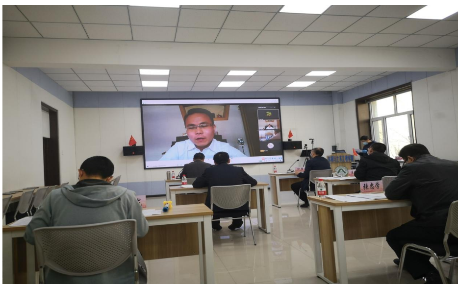
考生通过腾讯会议室远程面试