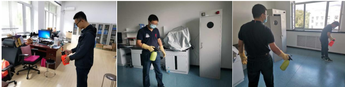
土木楼办公室、设计室和实验室消杀