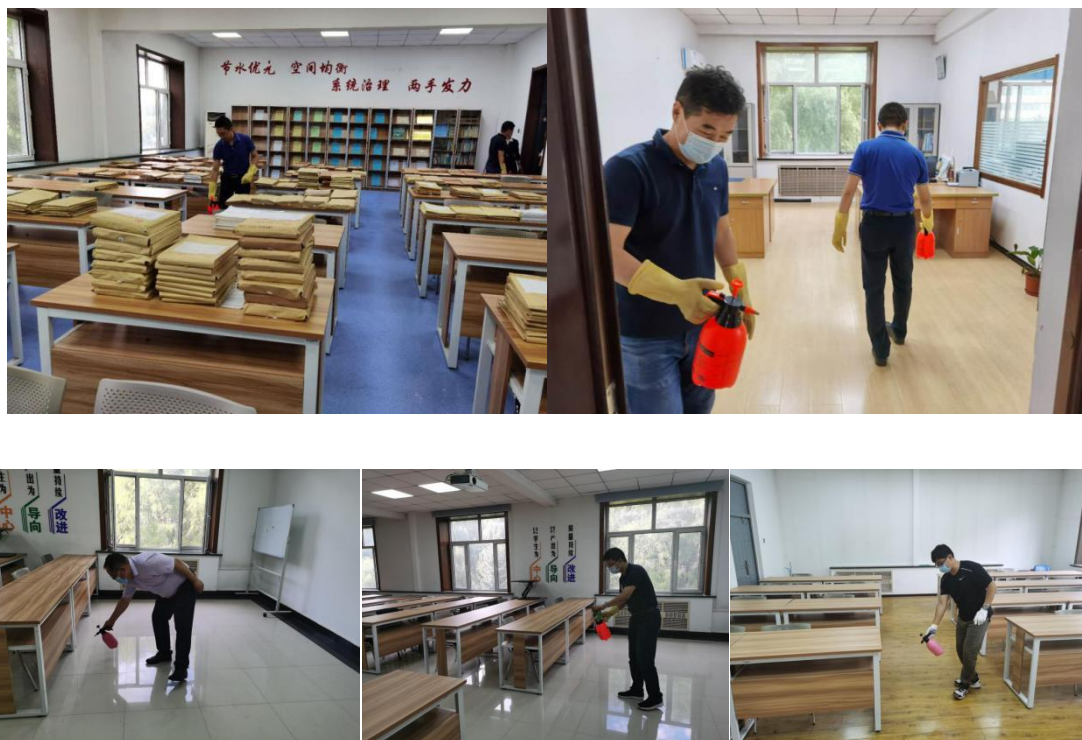
水利楼设计室和办公室消杀

学院要求各系、中心、办将消杀工作作为常规工作，定期对相关负责区域进行消杀。保障师生工作和学习环境的安全，保障后续实验课程和课程设计等实习课程的有序开展。