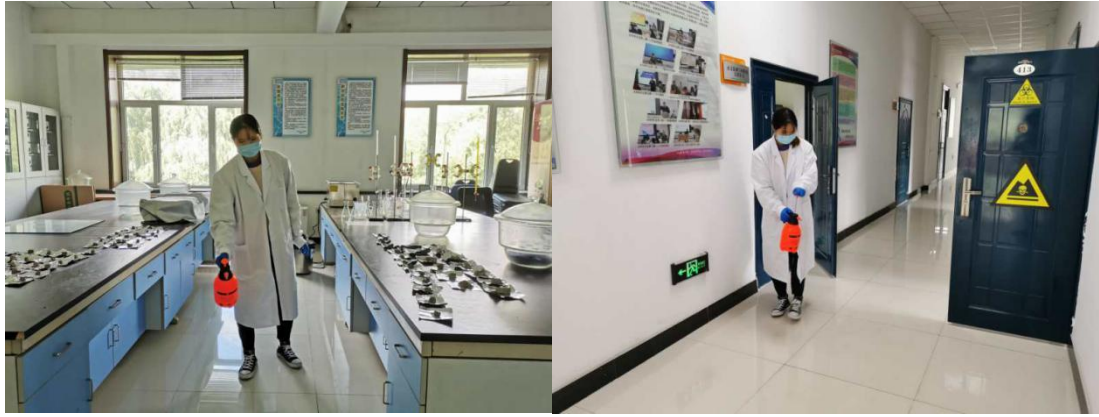
水利楼实验室和公共区域消杀