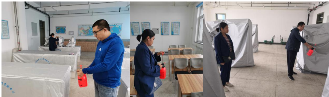
实验中心老师消杀实训中心各实验室