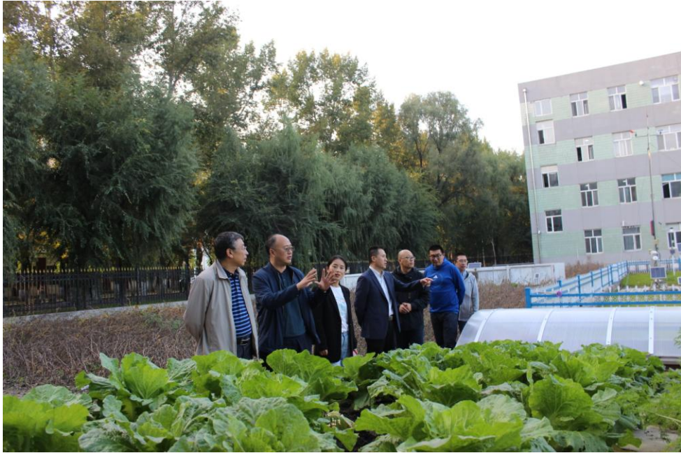
参观水利综合试验场