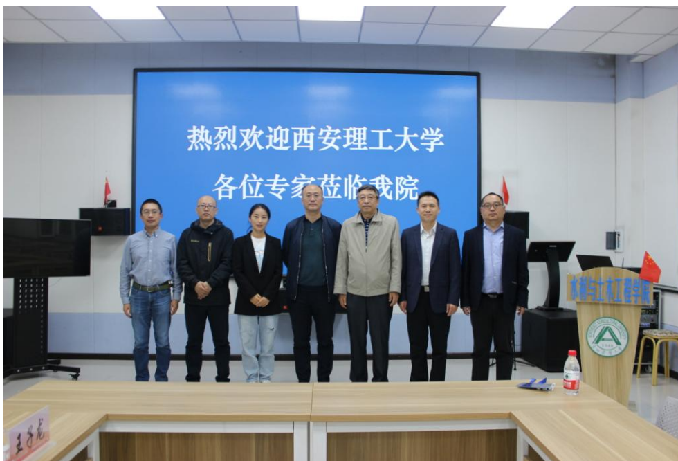
与会双方合影留念

西安理工大学水利水电学院此次到访我院，促进了我院的校际、院际合作与交流，提升了学院的知名度。