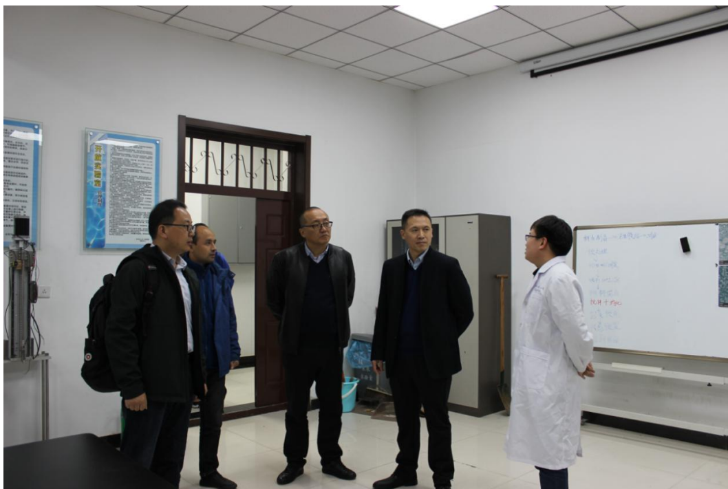
参观冻土工程实验室