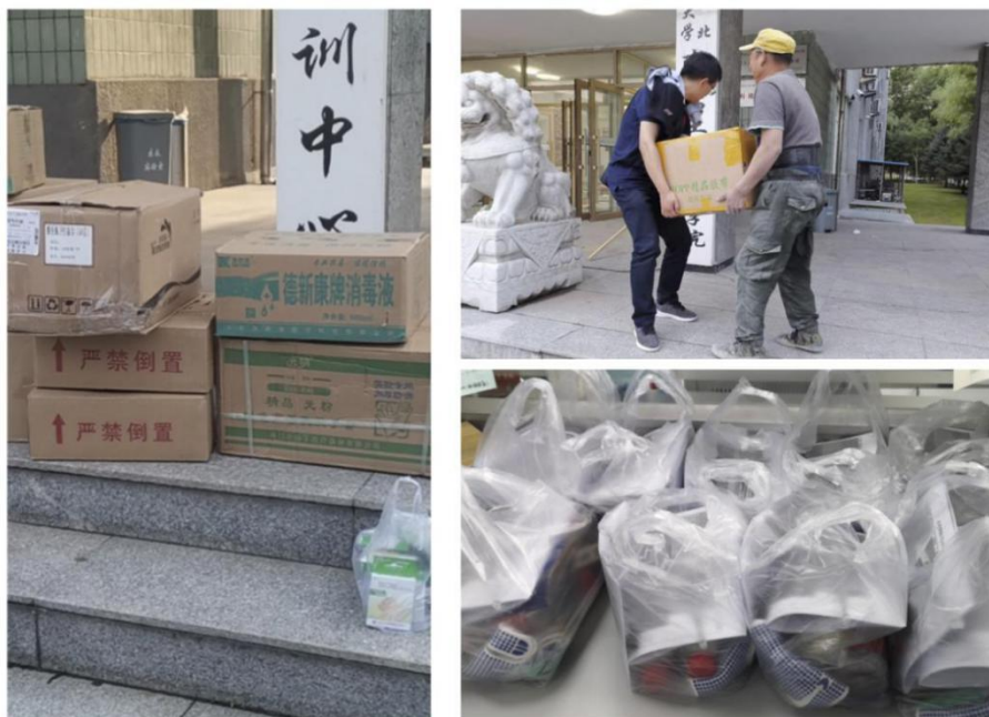
学院准备防疫物资