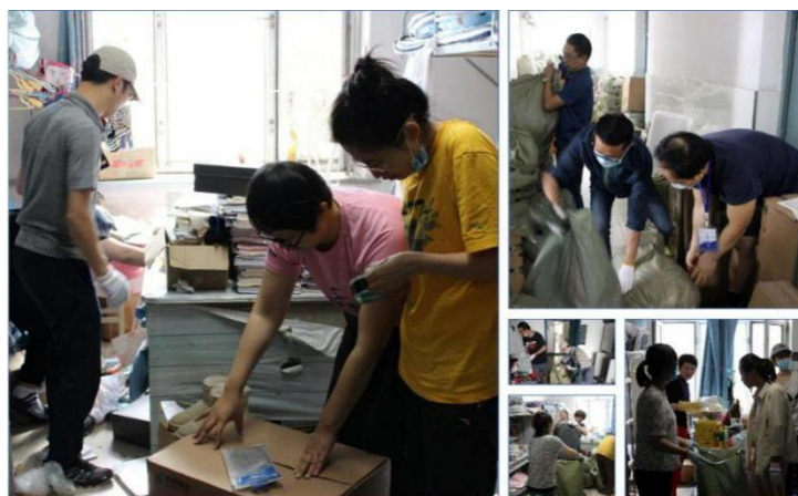
本科毕业生行李打包

面对 500 余名毕业生的行李打包任务，每一位教师志愿者都亲自整理物品、装箱、装袋、缠胶带，成功地化身为“兼职打包员”，同时，全体教师志愿者都放弃了端午节假期，坚守在自己的岗位上，体现了对学生深沉的爱。有的老师于 6 月 19 日晚就提前完成了 5 名硕士毕业生研究室物品整理任务，并发动他的爱人也加入了志愿者的行列；有的老师在入职手续还没有办完的情况下，就积极响应学院号召，加入到志愿者行列；有的老师在毕业生女寝人手不足、临时接到学院电话情况下，二话不说，第一时间赶赴现场增援；有的老师在帮助学生打包的同时，还及时在学院工作群里分享行李打包工作经验；有的老师由于劳累，蹲在地上帮助学生缠胶带，但她却笑着说，累趴下了也要完成任务；有的老师身体条件比较瘦弱，但依然坚持奋战在一线，通过视频电话与一位毕业生的母亲耐心地沟通了近 2 个小时，终于完成了该毕业生的行李打包任务；有的老师全程与学生视频，跪在地上耐心细致地为学生整理行李；有的老师穿着湿透的鞋子为学生整理行李长达 7 个小时；……每一名教师志愿者虽然挥汗如雨，身体很疲惫，但纷纷表示，这样的经历可能一辈子都碰不到一回，很难得，为了学生，值得！朴实的话语，却彰显了师者仁心！