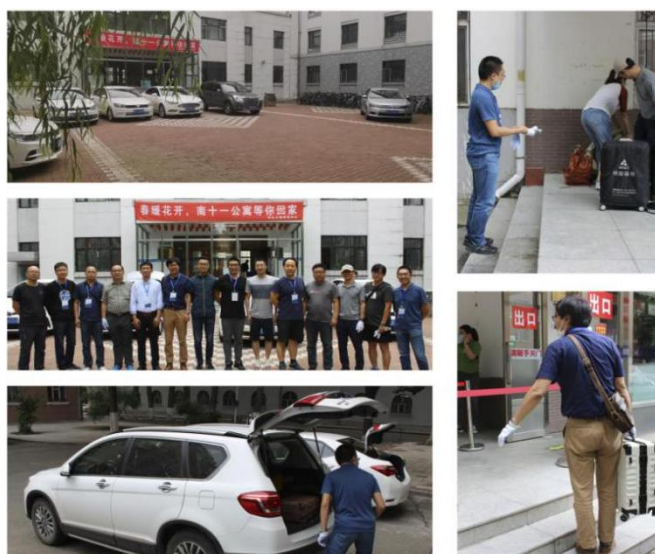
教师志愿者运送学生行李

6月24日凌晨六点，学院全体教师志愿者准时到岗，待学生核酸检测结果公布后，第一时间深入到8栋寝室楼103个毕业生寝室，13辆行李运输车守候在寝室楼下，随时准备为毕业生提供服务。几乎所有教师志愿者都将私家车停在寝室楼附近，随时听候学院调遣。