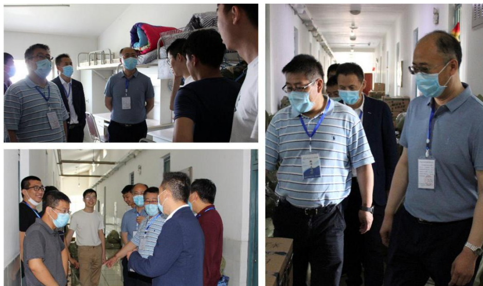
学院领导视察毕业生行李打包情况

学院全体领导始终坚守在学生寝室楼，深入到每一个学生寝室，靠前指挥，全面协调，确保所有寝室、每个床铺都落实到人、整理到位。